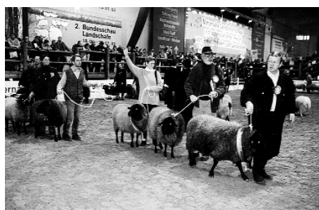
Die Gruppe der Rauhwolligen Pommerschen Landschaft