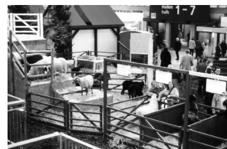
Die Aufstallung der Schafe erfolgte nach ihren Herkunftsregionen