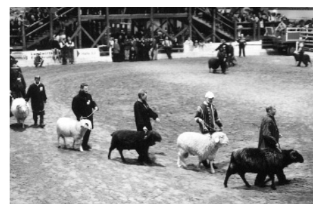
Beeindruckend ist die Vielfalt der gezeigten Rassen